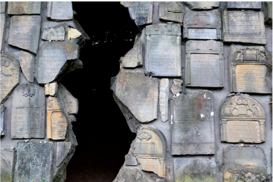
Jüdischer Friedhof mit rissiger Klagemauer in Czerniawy (Polen). Das Lapidarium, gesäumt mit Fragmenten historischer Matzevot, verweist auf das Klagen Jerusalems.

terdrückungen; unter dem Vorzeichen des Christentums fanden ungleich schlimmere Verbrechen statt als umgekehrt vorher die Juden an den Christen verübt hatten. Leider haben hier die Kirchen im Zusammenspiel mit staatlicher Macht eine unrühmliche Rolle gespielt, das soll deutlich gesagt werden. Nun ist es heute leicht, frühere Jahrhunderte moralisch zu verurteilen. Kritiker, welche die frühere Haltung der Kirche in der Judenfrage anprangern, sollten sich ehrlicher Weise fragen, was sie zum Beispiel gegen den seit Jahrzehnten laufenden Mord an ungeborenen Kindern tun. Nur wer ohne Schuld ist, darf den ersten Stein werfen.