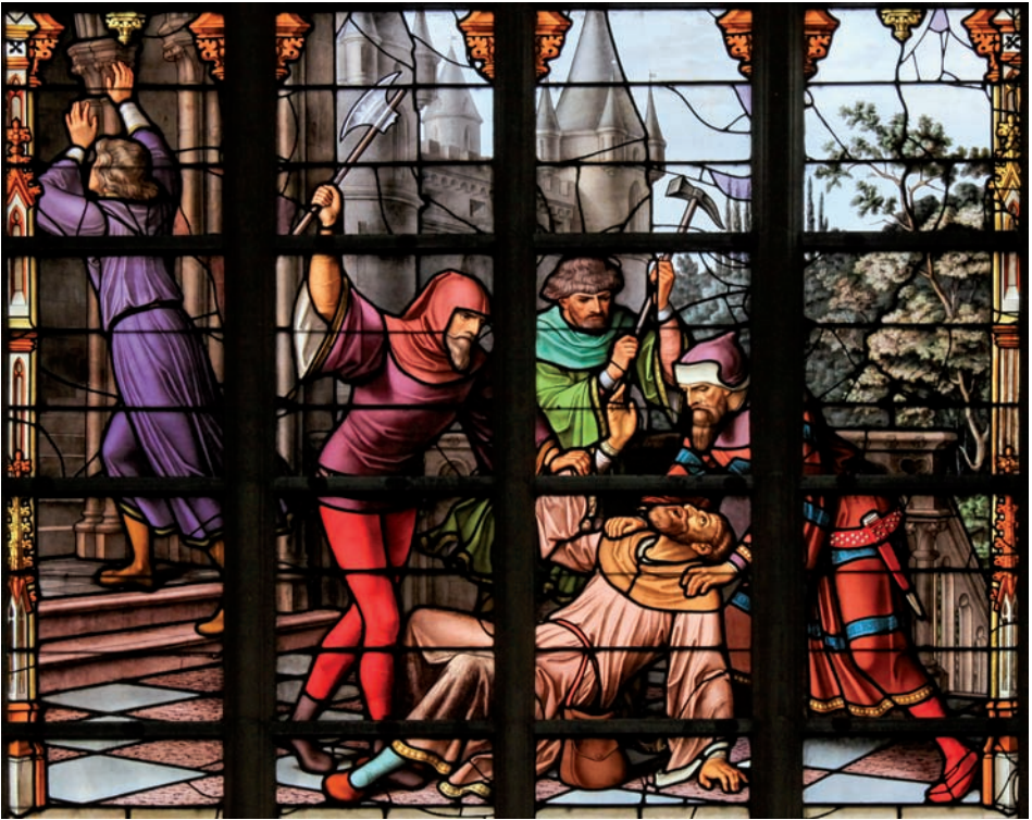
Antisemitische Glasmalerei in der Brüsseler Kathedrale (Verfolgung von Juden im Mittelalter).

Mit „ Antisemitismus “ verbindet man heute zumeist den Holocaust, Auschwitz und die Judenverfolgung in Deutschland und in weiten Teilen Europas in der Zeit der NS-Herrschaft, als etwa 6 Millionen Menschen (nehmen wir mal vorsichtig an, die Zahl stimmt) allein aufgrund ihrer Zugehörigkeit zum Judentum umgebracht wurden. Das ist nicht falsch, jedoch eine ungenaue bzw. verkürzte Sicht. Neben Antisemitismus gibt es auch den „Antijudaismus“ und den „Antizionismus“. Sind das nur andere Bezeichnungen für denselben Sachverhalt oder meint