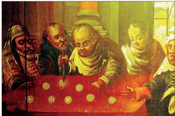
Darstellung eines fiktiven Hostienfrels (Detail): Ein Jude sticht mit einem Dolch in eine Hostie mit der Prägung des Antlitzes Jesu Christi ein, die Blut verliert.