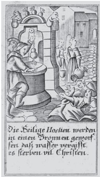
Die Heilige Hostien werden in einen Bronnen geworft, fert daß wasser vergiffte, es sterben vil Christen.

Unter Antijudaismus versteht man speziell diejenige Ablehnung bzw. Judenfeindlichkeit, die mit religiösen oder theologischen (Schein-) Argumenten begründet wird - dazu findet der Leser unten Beispiele - während sich der Antizionismus gegen das politische Bestreben der Juden richtet,